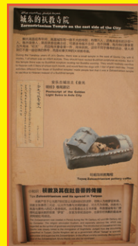
新疆ウイグル自治区 高昌故城からの出土品